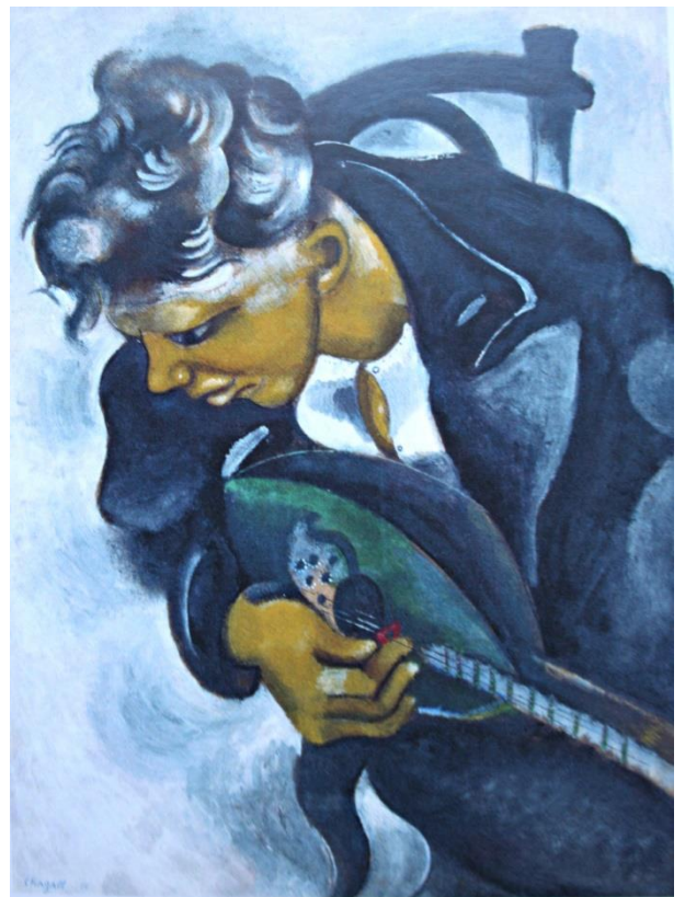
Texte : Lydie Verpoort-Vivier